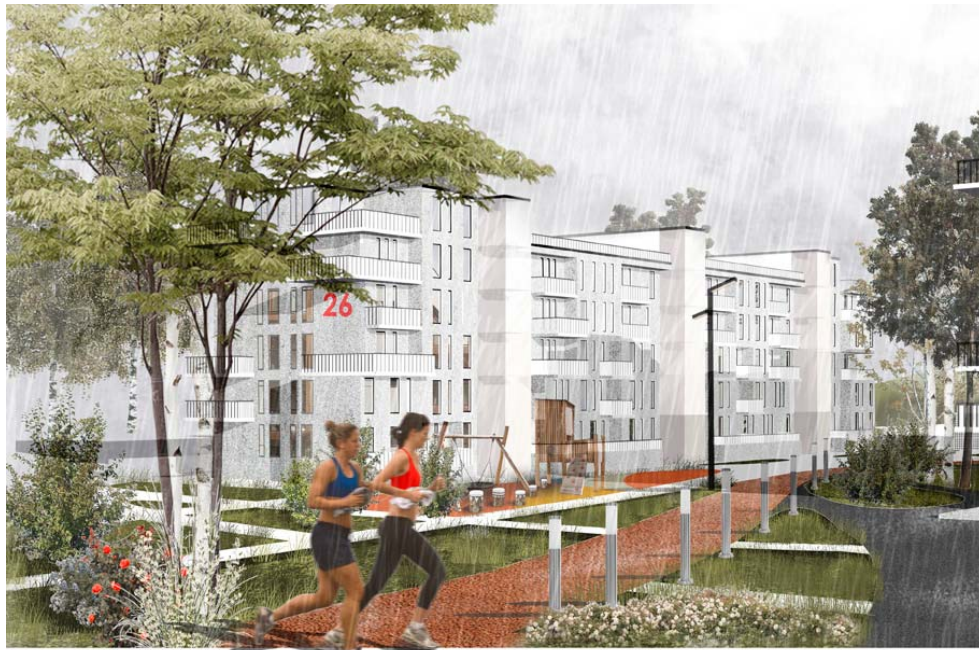
Рис. 1. Средовой подход в архитектурном проектировании ( http://gpvn/29519 )

Покажем принципиальную возможность реконструкции 5-этажных кирпичных зданий первых массовых серий (I-447) по стандартам зеленого строительства.