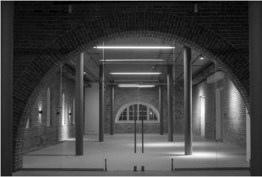
Рис. 8. Музей «Арсенал», интерьер, г. Нижний Новгород (2006—2015 гг., арх. рук. Е. Асс)

Борьбу между глобализмом и регионализмом показал конкурс PermMuseumXXI (Музей в Перми), который прошел уже 15 лет назад, но остался ярким событием в истории современной российской архитектуры. Местными властями делалась ставка на «эффект Бильбао» и осуществлялся запрос на визуально яркую, зрелищную криволинейную архитектурную форму (Тарабрина, 2008). Зарубежные члены жюри ориентировались как раз на использование регионального контекста, рекомендовали не замахиваться на грандиозные масштабы. Главный приз поделили швейцарский архитектор Валерио Олджати и российский — Борис Бернаскони. Третью премию присудили Захе Хадид. Проекты несовместимы и воплощают крайние направления в музейной архитектуре (рис. 9). Как ни парадоксально, региональное прочтение музея через советский контекст брежневского времени очевидно в проекте из Швейцарии, глобальное — в проектах Бернаскони и Хадид.