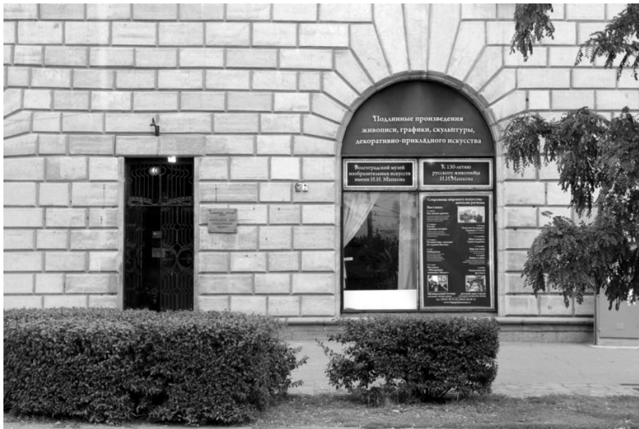
Рис. 10. Музей изобразительных искусств им. И. И. Машкова, г. Волгоград

нет более постоянного, чем временное. Сегодня единственный художественный музей региона занимает два встроенных помещения в жилых домах на проспекте Ленина и улице Чуйкова, которые не отвечают требованиям к хранению экспонатов и не позволяют музею в полной мере реализовать выставочный и творческий потенциал. Вместе с тем здесь находится вторая в мире по количеству и значимости работ коллекция Ильи Машкова — его картин в музее больше, чем в Третьяковской галерее. Вопрос о строительстве специального здания не решен до сих пор.