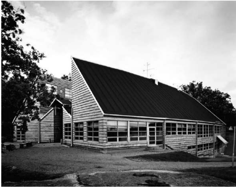
Рис. 5. Музей наскальных изображений бронзового века и раннего железного века Витлюке (Vitlycke) в Тануме, Швеция. Арх. К. Нюрен, 1999.

Особый интерес представляет проект нового музея в региональном центре Эстерсунде (арх. Х. Ларсен, 2015 г.) (рис. 6). Здание решено в виде деревянной скульптуры с легко узнаваемым силуэтом на фоне неба. Крыша спроектирована таким образом, чтобы глубокие световые люки проецировали мягкий северный дневной свет непосредственно в выставочное пространство. Архитектурное решение помогает новой постройке вписаться в исторический контекст, в том числе за счет масштаба и используемых строительных материалов.