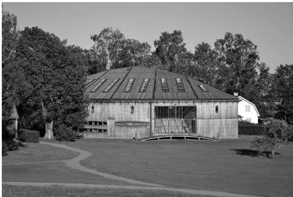
Рис. 4. Музей Старой Уппсалы, Швеция. Арх. К. Нюрен, 2000.

сохранилась средневековая церковь. Проектирование здания заняло долгий период 1993—1998 гг. В результате родился объект, который сохраняет традиции местности и вписывается в сложившийся ландшафт. Площадь здания составила 1200 м 2 , длина — 22 м, высота — 14 м, иными словами, это очень небольшие параметры. Музей в плане имеет овальную форму, чтобы, с одной стороны, не заслонять вид на исторические курганы, с другой стороны, форма здания ассоциируется с формой лодок, в которых хоронили викингов. С внешней стороны музей облицован дубовыми панелями.