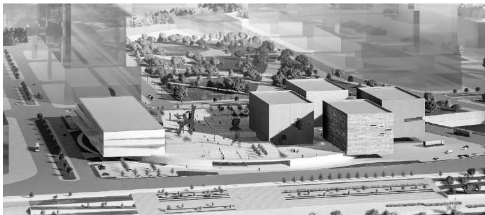
Рис. 3. Проект межмузейного кластера, Новая Москва. Арх. бюро IQ, 2022.

К музеям, формообразование которых идет в общем потоке глобализации, относится и проект межмузейного кластера в Новой Москве (рис. 3).