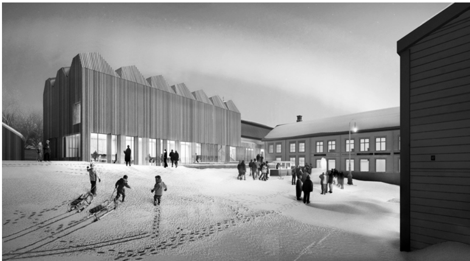
Рис. 6. Музей в Эстерсунде, Швеция. Проект. Арх. Х. Ларсен, 2015.

Особый интерес представляет проект нового музея в региональном центре Эстерсунде (арх. Х. Ларсен, 2015 г.) (рис. 6). Здание решено в виде деревянной скульптуры с легко узнаваемым силуэтом на фоне неба. Крыша спроектирована таким образом, чтобы глубокие световые люки проецировали мягкий северный дневной свет непосредственно в выставочное пространство. Архитектурное решение помогает новой постройке вписаться в исторический контекст, в том числе за счет масштаба и используемых строительных материалов.