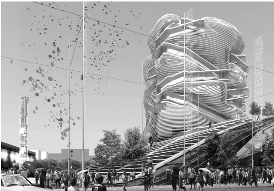
Рис. 2. Музей современного искусства (ГЦСИ) в Москве. Проект. Арх. М. Хазанов, 2009.

Проект, разработанный мастерской М. Хазанова (2009 г.), представляет собой оболочку произвольной формы, взметнувшейся на 16 этажей. Арт-критики по-разному отнеслись к этому проекту, некоторые отмечали, что время аттрактивности музеев Бильбао прошло (Ю. Авакумов) (Острогорский, 2012).