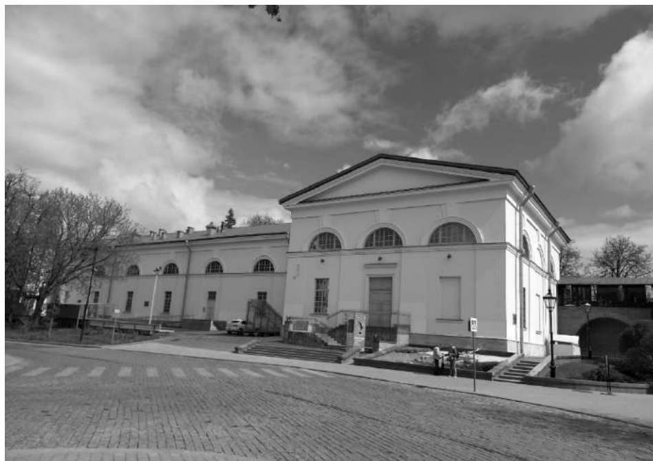
Рис. 7. Музей «Арсенал», г. Нижний Новгород (2006—2015 гг., арх. рук. Е. Асс)

Поражает разница экстерьера и интерьеров. Фасад восстановлен в первоначальном виде — в стиле русского классицизма. Зато внутренне пространство представляет собой гибрид исторических и современных решений. Кладка стены кремля с арочной аркадой была бережно восстановлена, а затем внедрена в экспозицию пространства в качестве экспоната, также воссоздана старая деревянная стропильная система. На первом и втором этажах устроена сплошная анфилада, без деления на части, как это было прежде нужно для военного хранилища. Разнообразные пространственные детали впечатляют, интерьеры меняют параметры в ширину и вверх, естественный свет из окон чередуется с искусственным освещением в замкнутых помещениях. Все новые части и элементы «Арсенала» не касаются исторических стен и выделены визуально. Бывший военный склад превратился в крупнейший центр современного искусства в России.