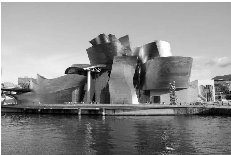
Рис. 1. Музей Гуггенхайма в Бильбао, Испания. Арх. Ф. Гери, 1997

Стоит напомнить, что именно музейная архитектура прозвучала своеобразным гимном глобализму через музей Гуггенхайма в Бильбао, Испания (1997 г., арх. Ф. Гери) (рис. 1). Расположенное на набережной здание воплощает собой абстрактную идею футуристического корабля, также его сравнивают с птицей, самолетом, суперменом, распускающейся розой. Музей сразу был признан одним из наиболее зрелищных в мире строений. Так, например, известный американский архитектор Филип Джонсон назвал его «величайшим зданием нашего времени» (Lee, 2007).