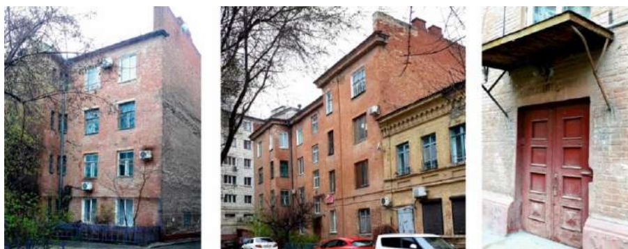
Рис. 4. Жилые дома по адресу: Пролеткультская, 3 и Пролеткультская, 5 (современное состояние)

В ходе Сталинградской битвы здание серьезно пострадало. Процесс послевоенной реконструкции существенно изменил облик дома. Угловые лоджии были частично заложены угловыми колоннами, что позволило увеличить площадь квартир. До войны дом имел арку для въезда во двор. После сноса строения по адресу Пролеткультская, 1 на освободившемся участке построили отдельно стоящий новый дом, и необходимость в сквозном проезде отпала, арку заложили, а на ее месте сформировались внутренние постройки. Напоминанием о бывшей арке является не используемый парадный вход, на его «парадность» указывают утратившие актуальность держатели под флагштоки по бокам от двери 4 . В настоящее время дом не принадлежит никакому ведомству, а его первый этаж отдан хостелу «ПролетКульт», который пользуется спросом в связи с расположением в центре города, недалеко от железнодорожного вокзала Волгоград-1 и автовокзала.