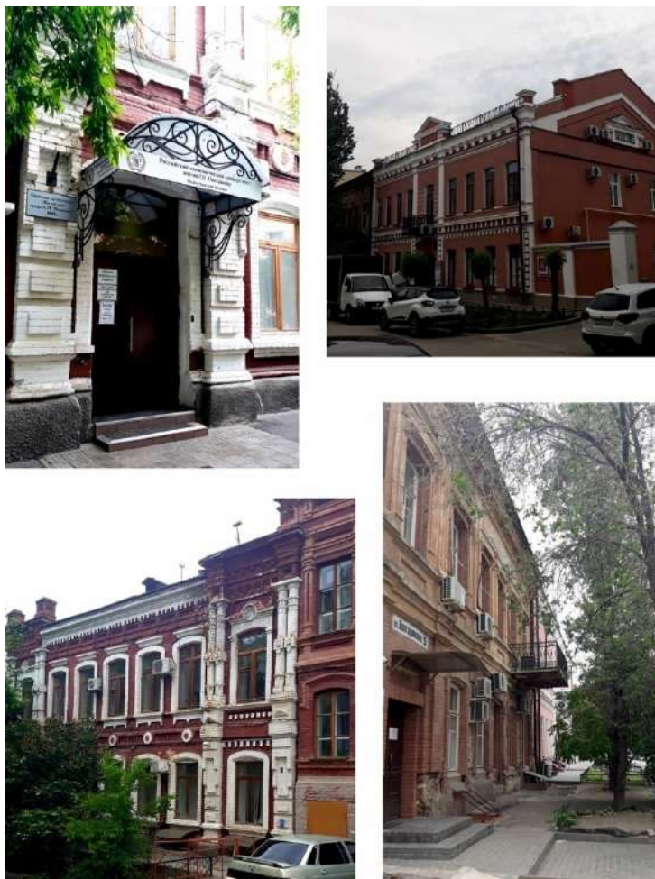
Рис. 5. Характерные элементы исторической среды ул. Волгодонской (фото современного состояния)

Состояние зданий по ул. Волгодонской удовлетворительное, но большинство бетонных элементов фасадов и крыльца, кирпичная кладка цокольной части и оконных перемычек частично обсыпались и разрушились, на фасадах присутствуют слои штукатурки, скрывающие особенности архитектуры царицынского времени. Но главное, этим постройкам было уделено внимание и нашлось применение еще до массовой современной застройки города. Все дома по улице Волгодонской на сегодняшний день отведены под ряд коммерческих и муниципальных предприятий, образовательных учреждений и объектов общественного питания. На верхних этажах некоторых из них расположено жилье.