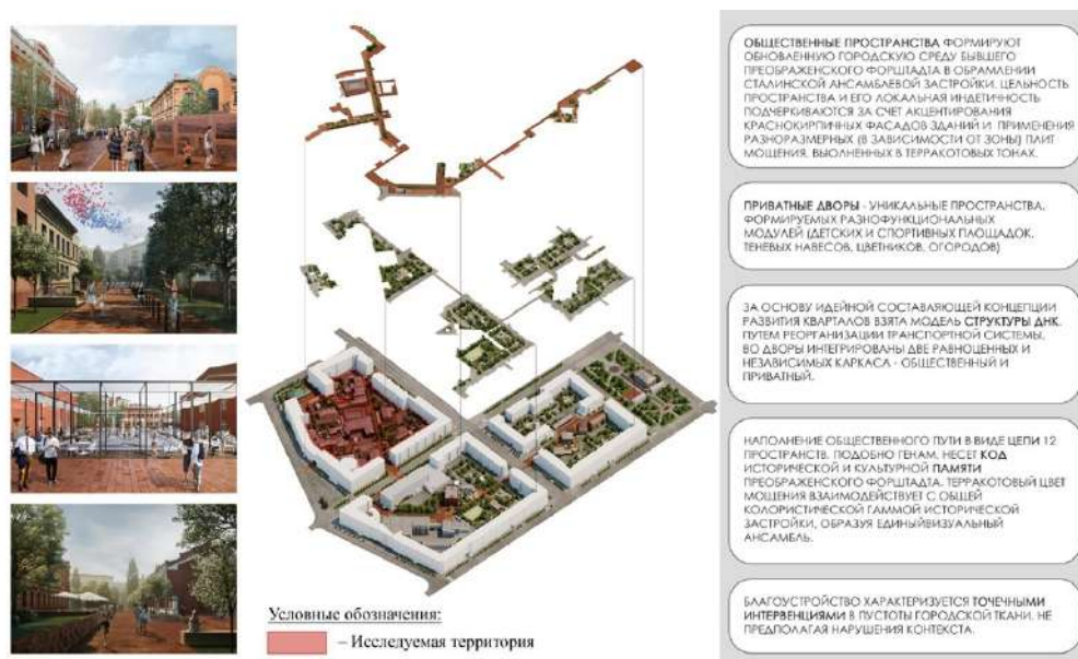
Рис. 6. Концепция развития территории от КБ Modul

Проектные разработки были неоднократно представлены на рассмотрение и обсуждение общественности города и жителям. Было высказано много предложений и замечаний, касающихся функционального наполнения участков, организации транспортно-пешеходного движения, однако единого мнения так и не достигнуто. Особенно остро встал вопрос специфики взаимосвязи частных внутридворовых территорий — зон влияния местных жителей и общедоступных территорий, ориентированных на прием других горожан и гостей города. Еще одним тормозящим моментом стало отсутствие заинтересованных инвесторов, готовых профинансировать столь масштабный проект.